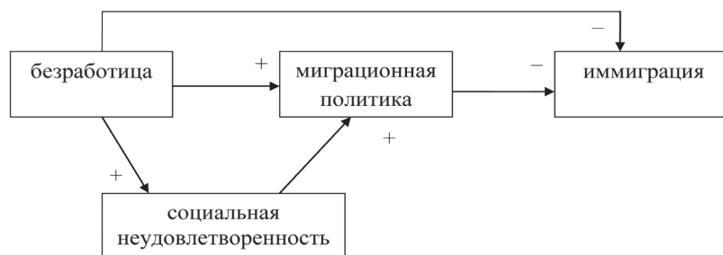
Рис. 2. Модель миграции, чувствительной к миграционной политике

Новейшие исследования показывают, что разворачивающаяся в настоящее время закономерность неоиндустриализации развитых национальных экономик приводит к притоку высококвалифицированных мигрантов в развитые экономики. Известные как «утечка мозгов» эти миграционные потоки специалистов подтверждают действие внешних эффектов при росте плотности населения и накоплении человеческого капитала. Ученые отмечают, что быстрое экономическое развитие, индуцированное научно-технической революцией, сопровождалось значительным увеличением населения, численность которого выросла с 1 млрд. чел. в 1850 г. до 3,6 млрд. чел. в 1970 г. [7; 8]. Этот факт отмечает и П. Ромер. В качестве первого условия резкого увели-